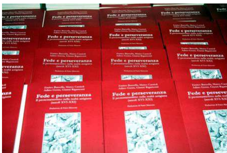
Sempre per questa ricorrenza, Sabato 18 Ottobre alle ore 16,30 presso il Salone Consiliare della Provincia di Asti è stato presentato il libro "Fede e Perseveranza - Il protestantesimo nella realtà astigiana, secoli XVI XXI".